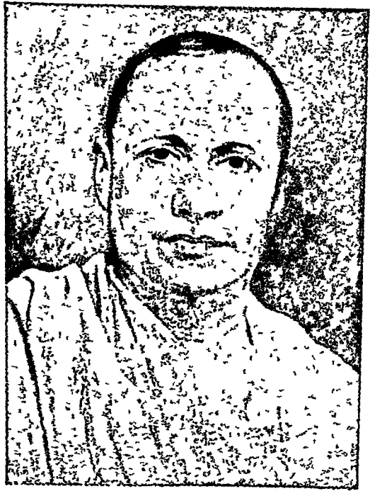
श्री जयशंकर प्रसाद